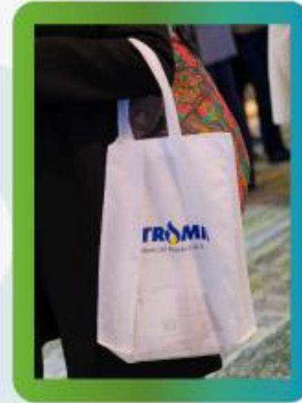
Logo a una sola tinta en bolsos para los asistentes.