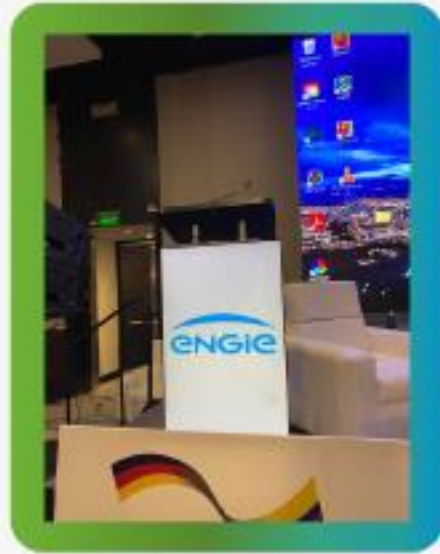
Logo en atril digital del evento académico - (exclusivo).